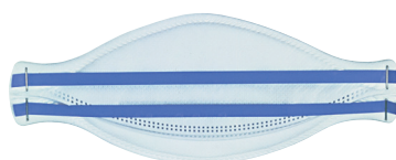
modrá - FFP2