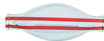
červená - FFP3