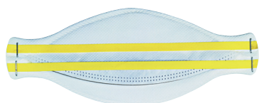
žlutá - FFP1

Stupeň filtrační třídy (FFP 1-3) je na respirátoru vyznačen tištěným kódem a zároveň barevným rozlišením na fixačních páskách nebo na nosní svorce (dle EN 149:2001).