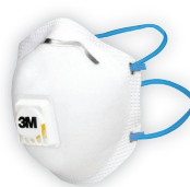
3M™ 8322 (FFP2) Filtrační polomaska