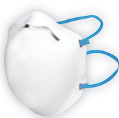
3M™ 8320 (FFP2) Filtrační polomaska