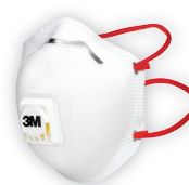
3M™ 8833 (FFP3) Filtrační polomaska