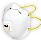
S ventilkem: 3M™ 8312 (FFP1) Filtrační polomaska